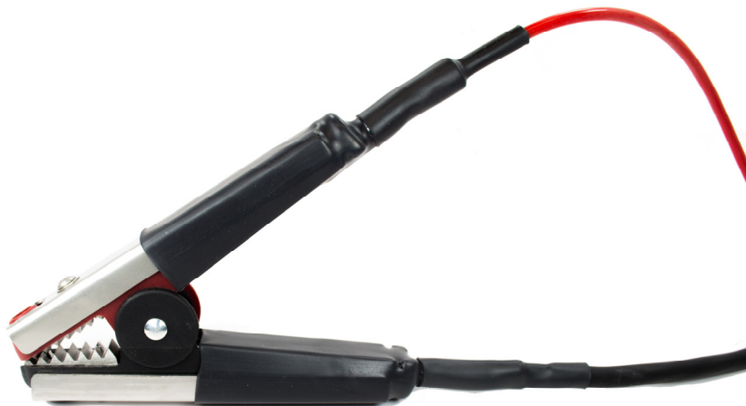
Pince Kelvin TEQAL à mâchoires courtes