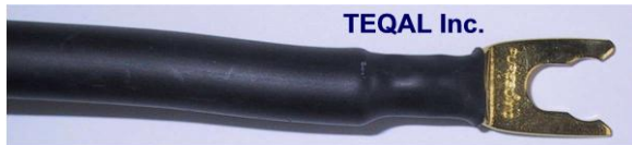
Fourchette plaqué or